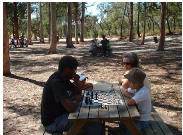
Xadrez na Mata da Machada - Barreiro