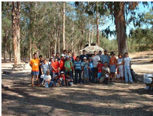
Agradecimentos ao Agrupamento de Escuteiros Nº 927 Santo André - Barreiro