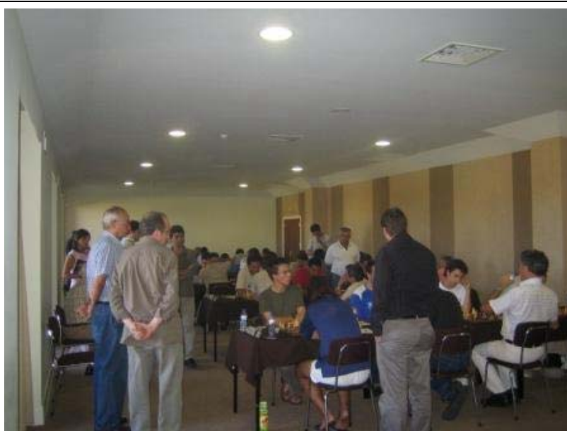
Uma das salas do Évorahotel, palco da 1ª divisão 2005

O Campeonato Nacional de Equipas da 1ª Divisão decorreu em Évora no Évorahotel, de 27 de Agosto a 4 de Setembro, com excelentes condições para a prática da modalidade. Contou com 13 Grandes Mestres Internacionais, 11 Mestres Internacionais e 8 Mestres F.I.D.E. de 12 países. A mais forte 1ª divisão de sempre.