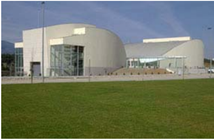
O Campeonato Nacional Absoluto Individual decorreu em Vila Real, no moderno Teatro de Vila Real, de 3 a 11 de Agosto.