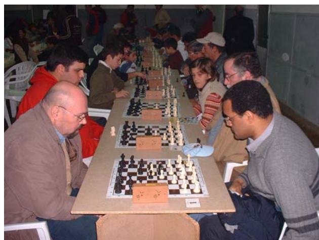
Circuito de Torneios do Barreiro 2006

Sessão Comemorativa do 30º Aniversário da Associação de Xadrez do distrito de Setúbal, dia 22 de Junho de 2006, pelas 21h30, no Auditório do Complexo Municipal dos Desportos "Cidade de Almada".