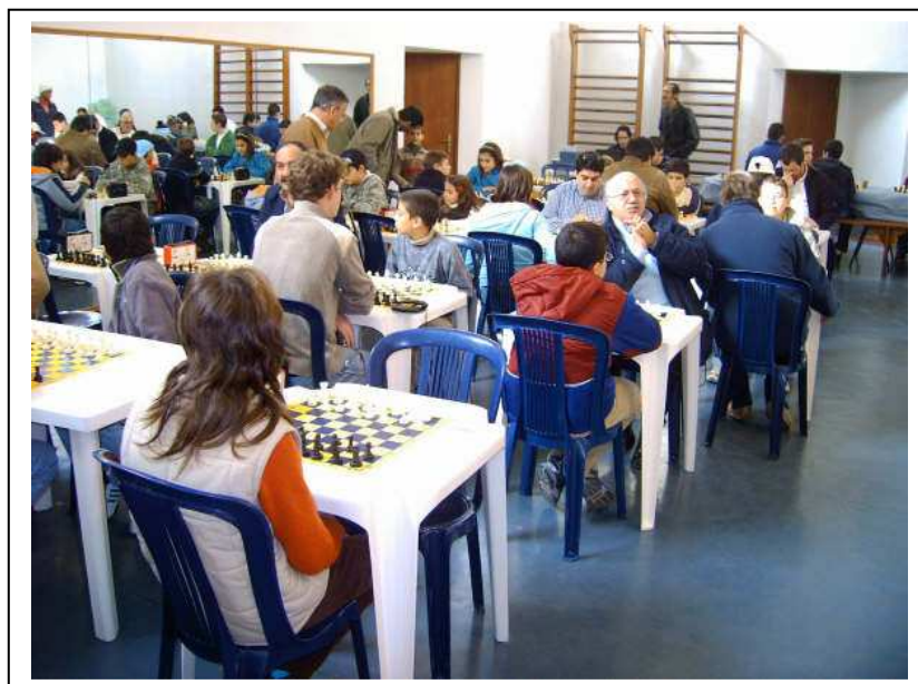
Fotografias dos Campeonatos Distritais de semi-rápidas realizados no Seixal