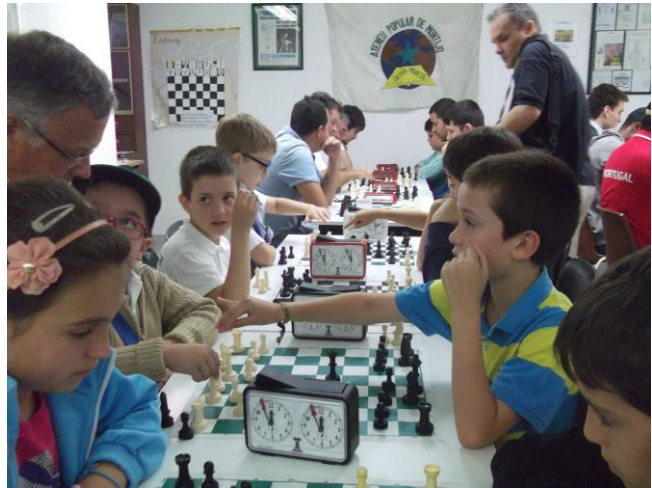
Campeonatos Distritais de partidas rápidas – Montijo