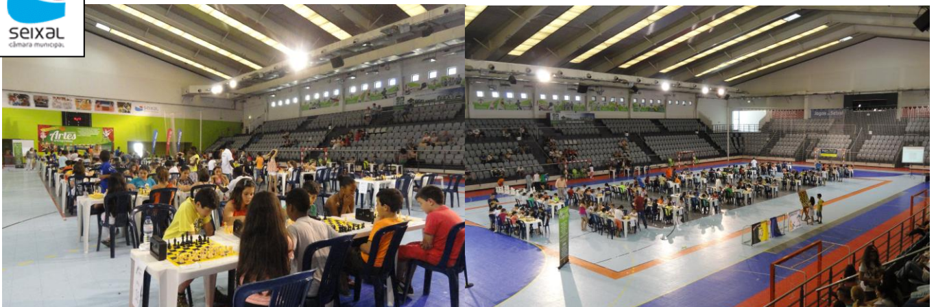
Fotos do 2º Torneio “Dia do Xadrez nas Escolas do 1º CEB”, que contou com a participação de 22 escolas, 35 turmas e 148 alunos, realizado no pavilhão municipal da Torre da Marinha-Seixal