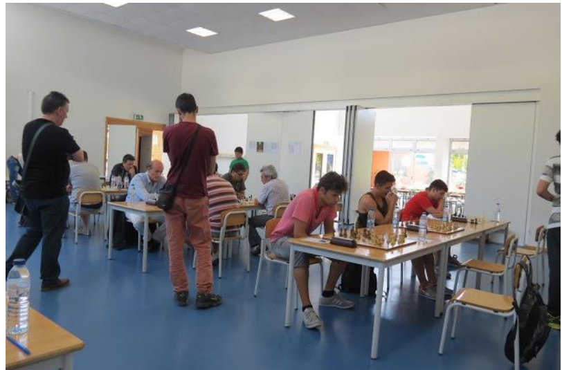
XI TORNEIO FIDE ALMADA - 2015

Colabore no Boletim da AXS, envie o seu artigo, seja de opinião ou de informação, para o e-mail da Associação de Xadrez do Distrito de Setúbal.